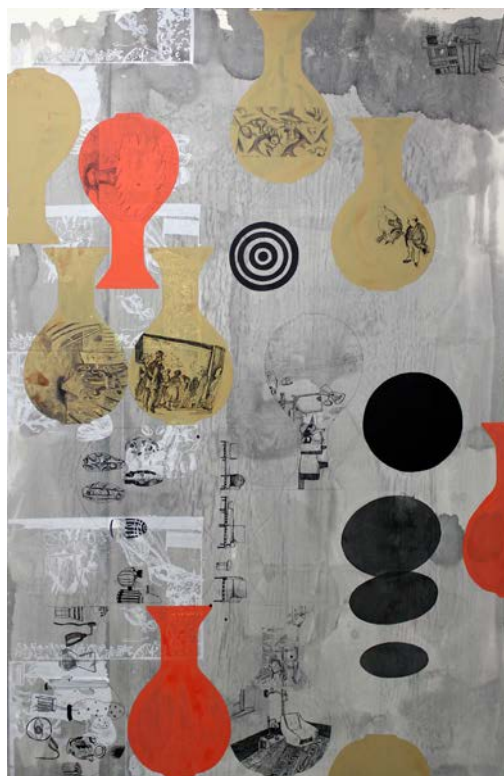
Photo: Alexandre & Florentine Lamarche-Ovize Collection particulière, Paris

Techniques mixtes sur papier 110 × 170cm