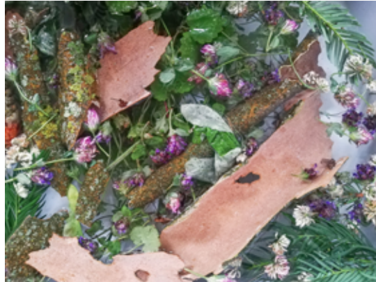
Préparation des plantes préalable à la confection d'une boisson