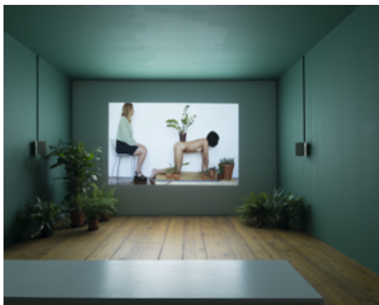
Night Soil / Fake Paradise , 2014, vue d'exposition à De Appel, Amsterdam Vidéo HD, sonore, couleur, 33,9 minutes