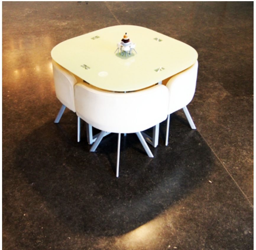
Salomé , 2015

Les œuvres pour l'exposition ont été réalisées avec le soutien de l'atelier Thomas Plasschaert.