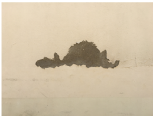
© Dector & Dupuy Repérages de Nevers