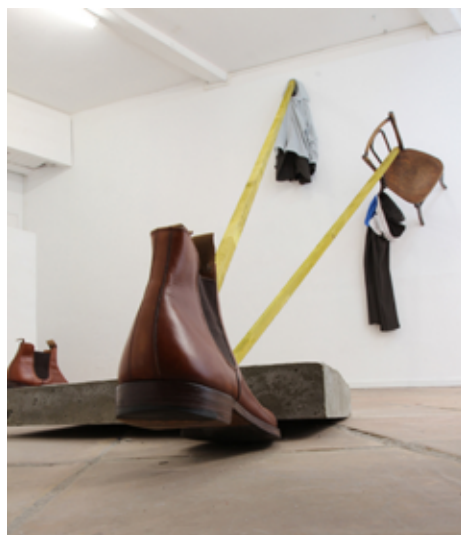
None to high, 2014 Chaussure, béton, bois, vêtements, chaise; dimensions variables

Eric Hattan travaille avec la Galerie Hervé Bize (Nancy) et Nicolas Krupp (Bâle). – hattan.ch