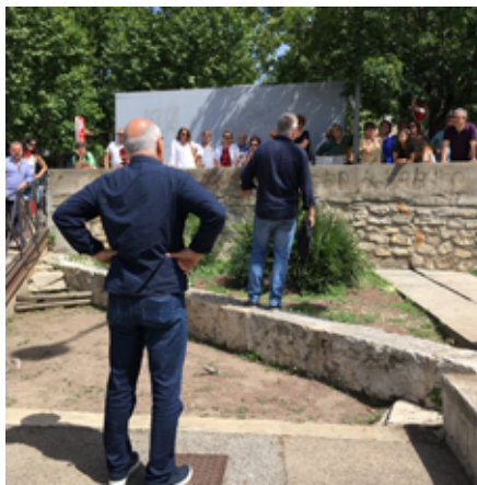
On sait la chance qu'on a , 2018 Performance, Arles

Dector & Dupuy sont représentés par la galerie Hervé Bize (Paris).