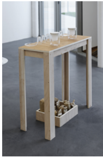
Les eaux - médiation, 2016-2017 Vue de l'exposition « Jump », CAC Brétigny, 2016-2017

En 2014 elle crée l'atelier de production collaborative en art et gastronomie Black Garlic, qui a notamment organisé des dîners à la Galerie, Centre d'art de Noisy-le-Sec en 2016-2017 ou au CAC Vilnius en 2015. Dans le cadre de sa recherche sur le breuvage, son usage et son pouvoir de transmission, elle a pu réaliser des performances, boissons ou poèmes tels que A State of Water pour Bétonsalon, Paris et Three States of Water au PAKT d'Amsterdam en 2017, Les eaux – médiation au CAC Brétigny en 2016-2017 ou encore The Companion , pour la Biennale de Liverpool en 2014.