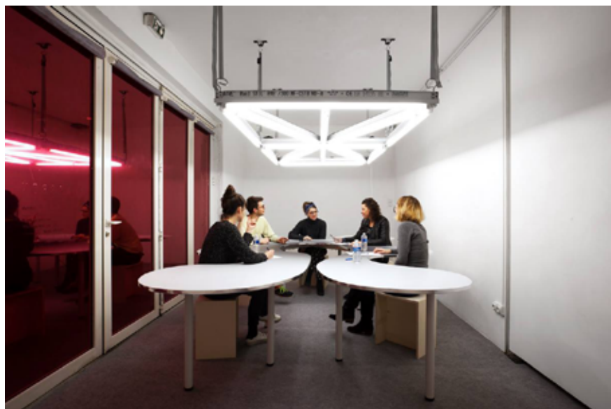
Le seul possible et l'échec, 2017 Installation participative, matériaux divers © Isabelle Giovacchini

Leur travail collectif a été montré lors de l'exposition monographique « Le seul possible et l'échec », à Glassbox, Paris, en 2017 et Le langage de l'événement a été notamment expérimenté en 2016 lors du Printemps de Septembre à Toulouse et de « Museum On/Off » au Centre Pompidou à Paris.