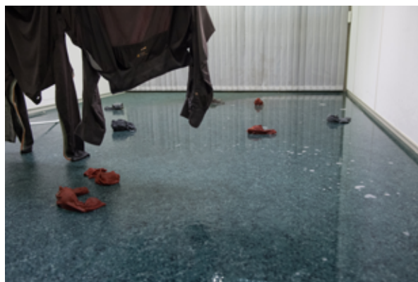
WArmNAssKAltTrocken, détail, 2018 Chemises, chaussettes, pommes de terre, eaux; dimensions variables

©Eric Hattan Courtesy Galerie Espace pour l'art, Arles