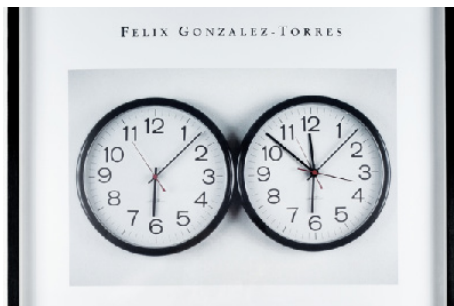
Yann Sérandour, Perfect Lovers , 2008

Les propositions qui suivent sont des pistes possibles d'ateliers. Le service des publics du centre d'art est à votre disposition pour échanger et pour développer conjointement un travail en amont ou en aval de la visite, en fonction de l'âge des participants.